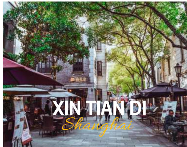
XIN TIAN DI Shanghai

ย่านใหม่ใจกลางเมืองเซี่ยงไฮ้ อีก 1 ย่านช้อปปิ้งและร้านอาหาร ร้านอาหาร ที่มีเอกลักษณ์ จากสถาปัตยกรรมที่ใช้อิฐบล็อกแบบสถาปัตยกรรมซีกเขมิน ซึ่งเป็นการผสมผสานกันระหว่างสถาปัตยกรรมจีนกับตะวันตกเข้าด้วยกัน ท่านจะพบกับทางเดินหิน กำแพงหิน ประตูหิน ที่มีเอกลักษณ์ โดย 2 ทางของถนนมีต้นไม้เปิดตลอดทาง ยิ่งทำให้ย่านนี้มีเสน่ห์เพิ่มเป็นเท่าตัว