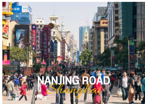
NANJING ROAD Shanghai

ถนนหนานจิง หรือที่รู้จักกันอีกชื่อว่า นานกิง ย่านช้อปปิ้งที่เก่าแก่และมีชื่อเสียงที่สุดในเซี่ยงไฮ้เลยในตอนเย็นจะเป็นช่วงที่ร้านค้าและบาร์ต่างๆกำลังคึกคักมีนักดนตรีริมถนนเต็มไปด้วยแสงสีเสียงเหมาะกับการเดินเล่นหรือนั่งรถรางชมบรรยากาศรอบๆฝั่งตะวันตกจะมีห้างสรรพสินค้าใหญ่ๆสลับกับร้านแบบจีนดั้งเดิมอยู่ตลอดสองข้างทาง