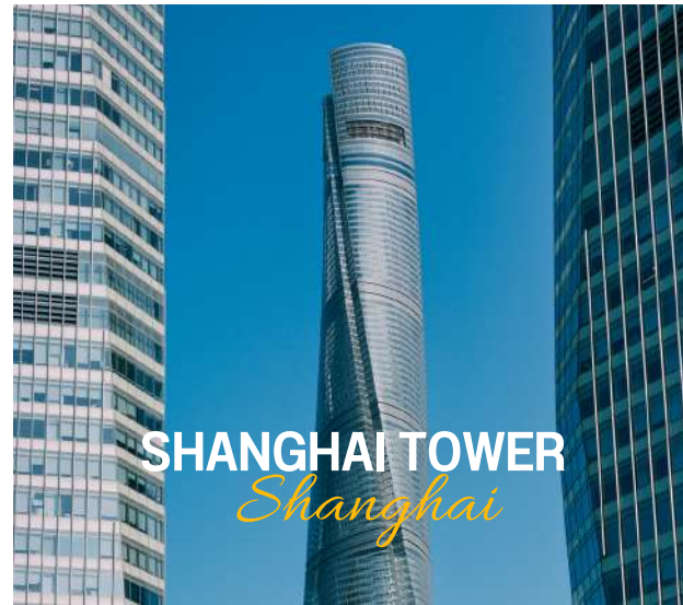
SHANGHAI TOWER Shanghai

เป็นหนึ่งในตึกระฟ้าที่ยิ่งใหญ่ที่สุดในโลกและเป็นสัญลักษณ์ของการพัฒนาและความเจริญก้าวหน้าของเมืองเซี่ยงไฮ้ในช่วงทศวรรษที่ผ่านมาตึกนี้ไม่เพียงแต่มีความสูงที่น่าประทับใจแต่ยังเป็นสัญลักษณ์ของความทันสมัยและนวัตกรรมในด้านสถาปัตยกรรมและวิศวกรรมความสูงเซี่ยงไฮ้ทาวเวอร์มีความสูง63เมตรตึกที่สูงที่สุดในจีน และ อันดับที่ 2 ของโลก รองจาก เบิร์จคาลิฟา ที่ดูไบ ตึกนี้มี 128 ชั้น โดยมี 5 ชั้นใต้ดิน และการออกแบบที่มีการลดขนาดตัวอาคารจากฐานขึ้นไปยังชั้นบนทำให้รูปร่างของตึกดูเหมือน"ขวดลด"หรือ "เกลียว"ซึ่งช่วยให้ตึกมีความมั่นคงและสามารถต้านทานลมแรงได้ดี กระจกโปร่งแสงและเหล็กกล้าเพื่อให้ตึกมีลักษณะทันสมัยและสะท้อนความเป็น เมืองแห่งอนาคต