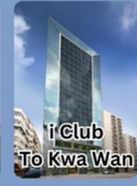
i Club To Kwa Wan

คอนเฟิร์มเดินทาง พฤศจิกายน 2567 2-4 / 9-11 / 16-18 23-25 / 30 พ.ย. - 2 ธ.ค.