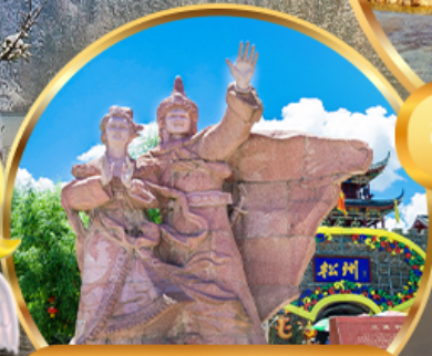
เมืองโบราณขงฟาน