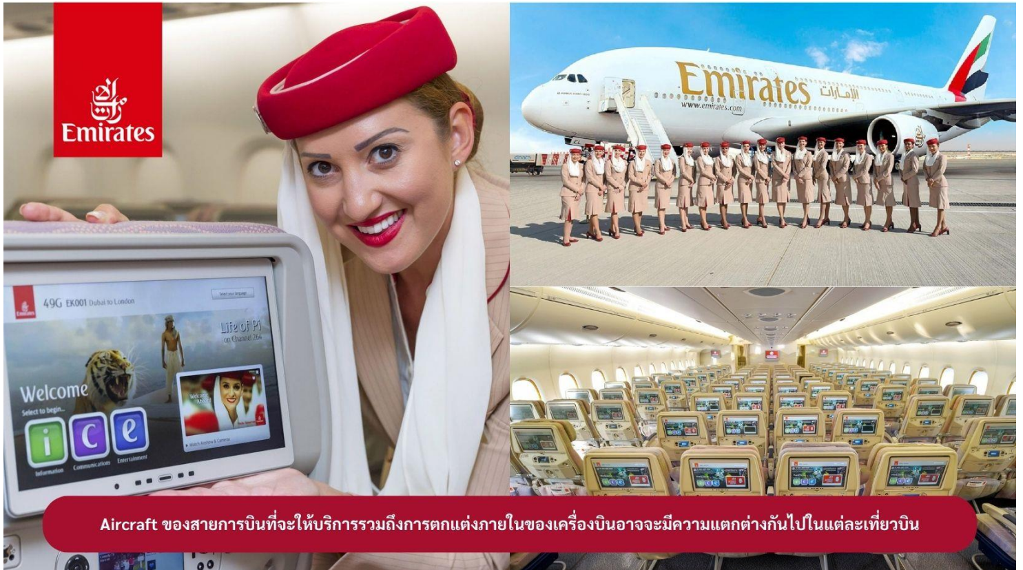
Aircraft ของสายการบินที่จะให้บริการรวมถึงการตกแต่งภายในของเครื่องบินอาจจะมีความแตกต่างกันไปในแต่ละเที่ยวบิน

23.00 น. 🛫 คณะเดินทางพร้อมกัน ณ สนามบินสุวรรณภูมิ อาคารผู้โดยสารขาออกระหว่างประเทศ ชั้น 4 ประตู 9 แถว T สายการบินเอมิเรตส์ แอร์ไลน์ (EK) เจ้าหน้าที่ให้การต้อนรับและอำนวยความสะดวก