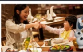
อาหารเข้าในห้องพักดิสนีย์