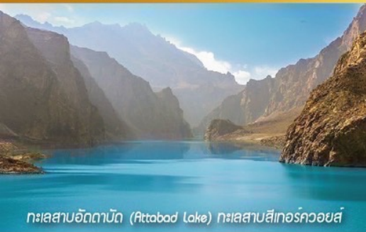
ทะเลสาบอิตตาบัด (Attabad Lake) ทะเลสาบสีเทอร์ควอยซ์