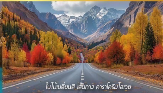
ใบไม้เปลี่ยนสี เส้นทาง คาราโครัมไฮเวย์