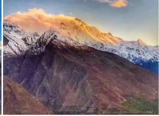
พักโรงแรมหุบเขาดยูเกอร์