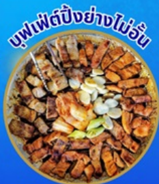
บุฟเฟ่ต์ปิ้งย่างไม่อั้น