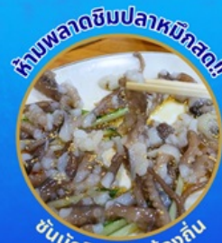
ข้าวผัดซิมปลาหมึกสด

โพลังสเปซวอล์ค สกายวอร์ค ตามรอยซีรีส์ Hometown chachacha ถ่ายรูปชิคๆ หมู่บ้านวัฒนธรรมคิมซอน ขึ้นเคเบิลคาร์ ชมทะเลปูซาน นั่งรถไฟปูคปิก sky capsule ชิมของอร่อยตลาดแฮนแด อิสระช้อปปิ้ง Lotte Duty Free