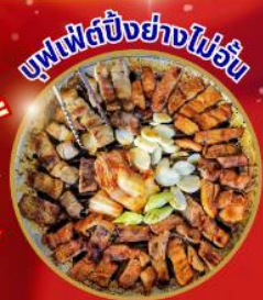
บุฟเฟ่ต์ปิ้งย่างไม่วัน