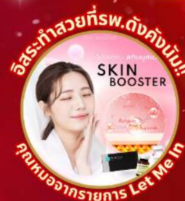
อิสระทำสวยที่พ.ดังคังนัม!! SKIN BOOSTER คุณงามความดี Let Me In

ชมจอ LED ขนาดยักษ์ที่รีสอร์ท 5 ดาว ใหญ่ที่สุดในเอเชียเหนือ ชมพระราชวังคยองบกคุง ย้อนอดีตหมู่บ้านบุคซอน อันอก ใส่ชุดฮันบก ทำข้าวห่อสาหร่าย อิสระช้อปปิ้ง Lotte Duty Free