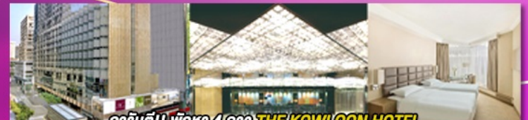
การันตี!! พักหรู 4 ดาว THE KOWLOON HOTEL ติดถนนนาราน ย่านช้อปปิ้งจิมซาจู้