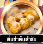
ติ่มซำต้นตำรับ