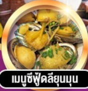
เมมูซึฟู้ดลึยมูนูน