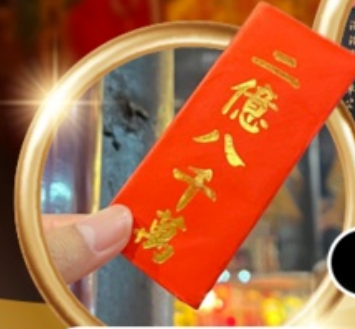
ยืมเงินเจ้าแม่กวนอิม