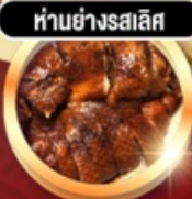
ทำนย่างรสเลิศ