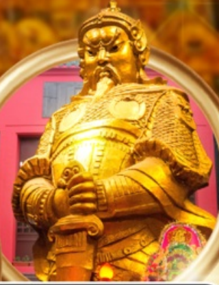
วัดเซ่งเตง

• วัดเจ้าแม่กวนอิมสองห้า • นั่งรถรางพีคแถม • อ่าวรีพัลส์เบย์