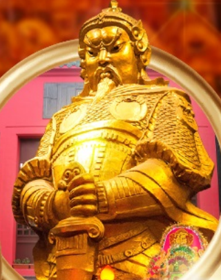
วัดเซ่งเตง