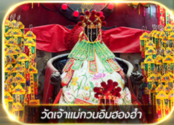
วัดเจ้าแม่กวนอิมสองอ้า