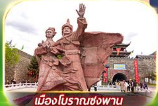
เมืองโบราณซ่งพาน