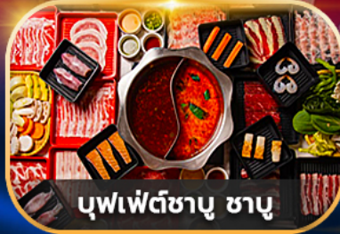
บุฟเฟ่ต์ชาบู ชาบู