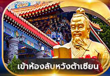
เข้าห้องลับหวังต้าเซียน