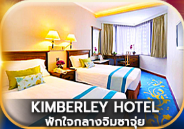
KIMBERLEY HOTEL พักใจกลางจิมซาจุ่ย