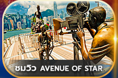
ชมวิว AVENUE OF STAR