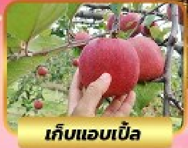
เก็บแอมเปิ้ล

พักดี 4 ดาว ★★★★★ HAKODATE KOKUSAI HOTEL 1 คืน TOYA SUN PALACE 1 คืน JOZANKEI VIEW HOTEL 1 คืน SAPPORO STREAM HOTEL 2 คืน