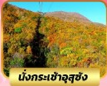
นั่งกระเช้าอุซุซัง