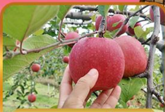
เก็บแอบเปิ้ล