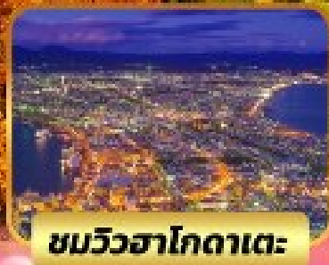
ชมวิวฮาโกดาเตะ