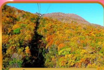
นั่งกระเช้าอุซุซัง