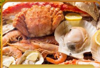
ปิ้งย่างร้านดังมันดะ