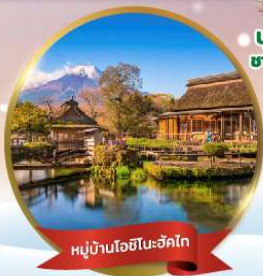
หมู่บ้านโอชิโนะฮักโกะ