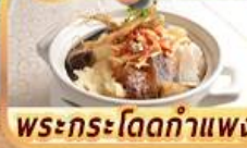
พระกระโดดกำแพง