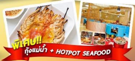
พิเศษ!! ก๊วยแม่น้ำ + HOTPOT SEAFOOD