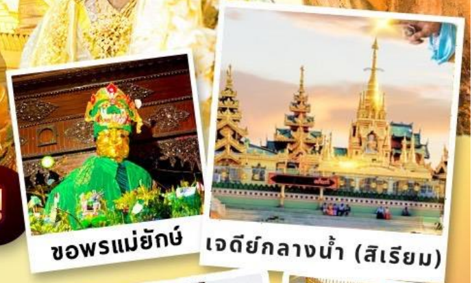
ขอพรแม่ยักษ์ เจดีย์กลางน้ำ (สิริเยม)