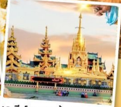
เจดีย์กลางน้ำ (สิเรียม)