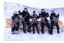
สนุกกับกิจกรรมจับปูยักษ์

00.00 น. ออกเดินทางสู่ เมืองคีร์กเคนส โดยสายการบิน...เที่ยวบินที่... 00.00 น. เดินทางถึงสนามบินเมืองคีร์กเคนส