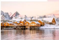
หมู่บ้าน Sakrisoy