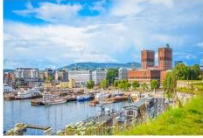
เมืองออสโล

06.10 น. เดินทางถึงนครอิสตันบูล ประเทศตุรกี (แวะเปลี่ยนเครื่อง) 09.00 น. ออกเดินทางสู่กรุงออสโล ประเทศนอร์เวย์ เที่ยวบินที่ TK 1751 11.00 น. เดินทางถึงสนามบินสนามบินเมืองออสโล