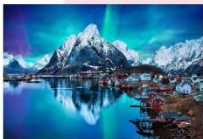
หมู่เกาะโลโฟเทน

00.00 น. ออกเดินทางสู่ เมืองเลกเนส โดยสายการบิน Scandinavian Airlines เที่ยวบินที่ SK 4106 แวะเปลี่ยนเครื่องที่เมือง Bodo เป็นสายการบิน Wide roe WF 810 00.00 น. เดินทางถึงสนามบินเมืองเลกเนส