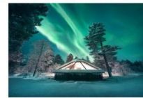
Glass Igloo Hotel

** พักที่ NORTHERN LIGHTS VILLAGE OR SIMILAR **