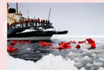
ล่องเรือตัดน้ำแข็ง Ice Breaker