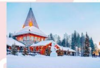
หมู่บ้านซานต้าครอส

15.25 น. ออกเดินทางสู่อิสตันบูล ประเทศตุรกี เที่ยวบินที่ TK 1750 21.10 น. เดินทางถึงสนามบินอิสตันบูล (แวะเปลี่ยนเครื่อง)