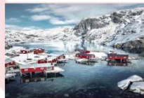
หมู่บ้าน Nusfjord

** พักที่ ELIASSEN RORBUER OR SIMILAR **