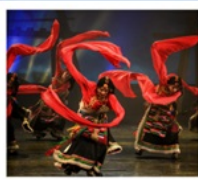
โชว์ทิเบต