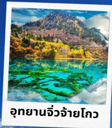
อุทยานจิวจ้ายโกว