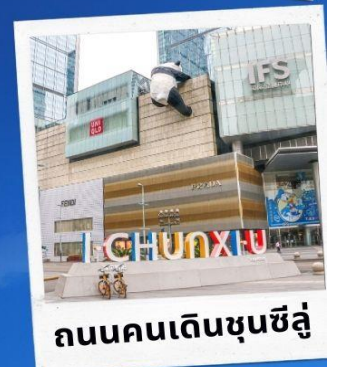
ถนนคนเดินชุนซีลู่