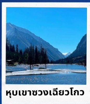
หุบเขาชวงเจียวโกว