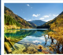
จิวจ้ายโกว

อุทยานภูเขาสี่ดรุณี / อุทยานชวงเจียวโกว / ทะเลสาบเตี้ยซีไห่ / อุทยานแห่งชาติจิวจ้ายโกว โชว์ทิเบต / เมืองโบราณซงพาน / ซอยกว้างแค้น / POP MART / ถนนคนเดินซอยกว้างแค้น