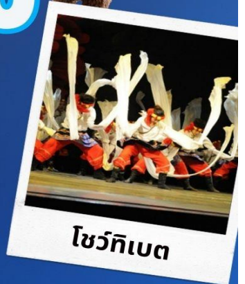
โชว์ทิเบต