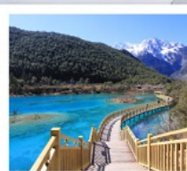
โป๋สุ่ยเหอ