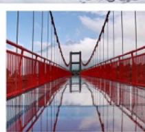
สะพานแก้วลี่เจียง