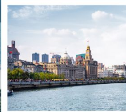
หาดว่อกาน