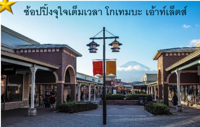
ช้อปปิ้งจุใจเต็มเวลา โกเทมบะ เอ้าท์เล็ตส์