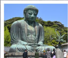
วัดโคโตคุอิน