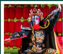
โชว์เปลี่ยนหน้ากาก