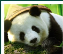
ศูนย์หมีแพนด้า