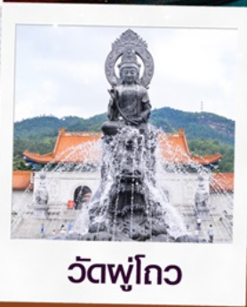
วัดพุทโธ