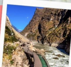
ช่องแคบเสือกระโจน รวมบันไดเลื่อน ขึ้น-ลง