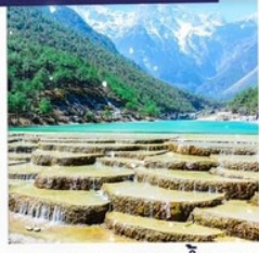
ทะเลสาบธารน้ำขาว รวมรถแท็กซี่