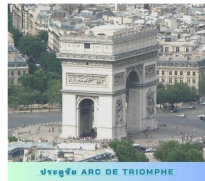
ประตูชัย ARC DE TRIOMPHE