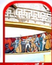
อนุสาวรีย์ โซซาน