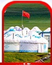
หมู่บ้าน พื้นเมือง