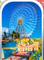
เมืองแฟนตาซี