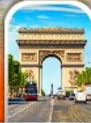
ARC DE TRIOMPHE FRANCE