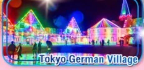
Tokyo German Village