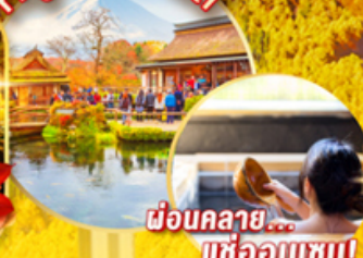
นั่งลอย... แช่ออนเซน!

📍 โฮโตะ!! นั่ง Gondora lift ชมวิว HAKUBA IWATAKE MOUNTAIN สะดุดตาไปกับ ไม้เปลี่ยนสี สดใส ณ อุโมงค์เมเปิ้ล หรือ โมมิจิ หมู่บ้านโอชิโนะฮักโกะ วิวภูเขาไฟฟูจิสีจางติดกับพื้นหลังสีฟ้า ชม สะพานโทเกดสึเคียว จ้ำมแม่น้ำโออิงว่าบริเวณเชิงเขาราชยาม่า ซุปป์ิงจู่ใจ โอโตะบะ และ ซินจุกุ พร้อมเช็คอิน แอมย์กซ์ 3 มิติ