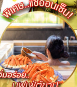
อิมมอร์รี่... บุฟเฟ่ต์ขาปู