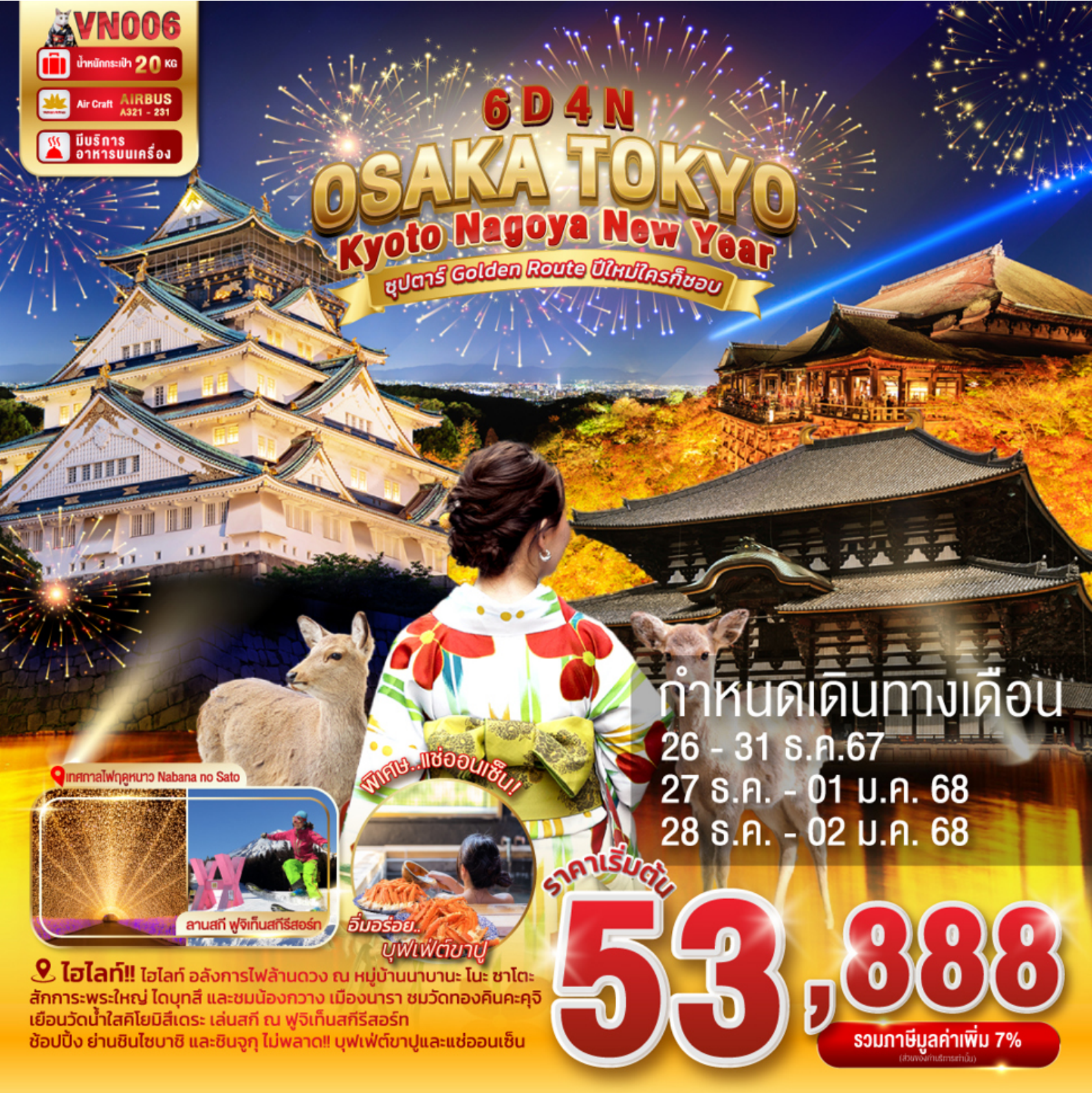
📍 เทศกาลไฟฤดูหนาว Nabana no Sato