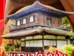
ชมสวนสโตนี่ญี่ปุ่น... Ginkakuji Temple