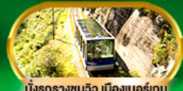
นั่งรถรางชมวิว เมืองเบอร์กิน