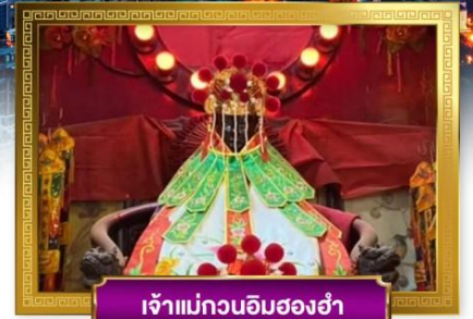
เจ้าแม่กวนอิมสองห้า