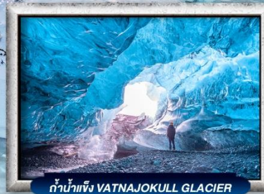
ถ้ำน้ำแข็ง VATNAJOKULL GLACIER

บินทรู สายการบิน Full Service | พิเศษ! ทานอาหารโดมกระจกิว 360 องศา