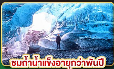
ชมถ้ำน้ำแข็งอายุกว่าพันปี