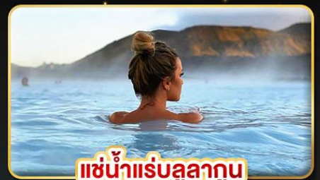
แช่น้ำแร่สุขภาพ