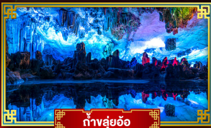
ถ้ำลุย้อ

"ดินแดนแห่งสายน้ำและขุนเขา" สัมผัสประสบการณ์นั่งบอลลูนชมวิวมุมสูง