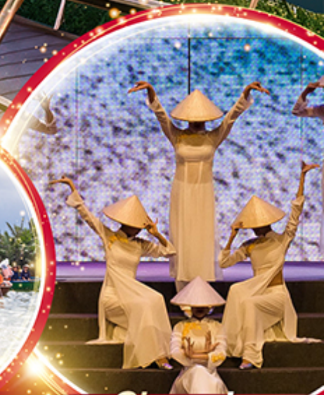
Charming Danang Show