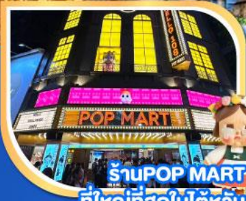
ร้าน POP MART ที่ใหญ่ที่สุดในโลก