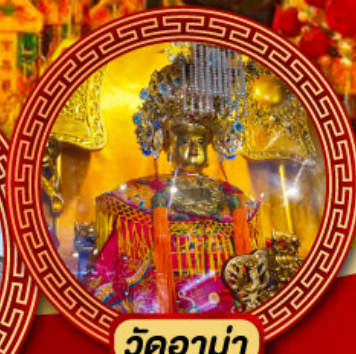
วัดอาม่า