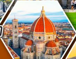
ฟลอเรนซ์