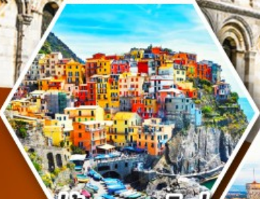
หมู่บ้านมานาโรล่า