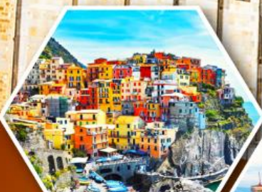
หมู่บ้านมานาโรล่า