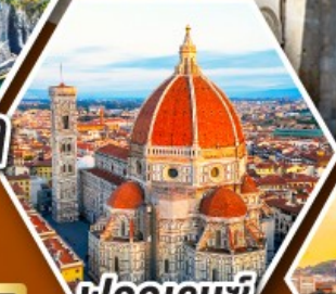
ฟลอเรนซ์