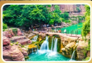
อุทยานหยุ่นโกซาน