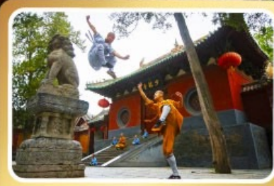
วัดเส้าหลิน