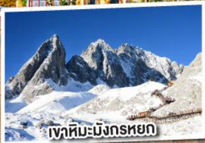
เขามะมิงกรหยก