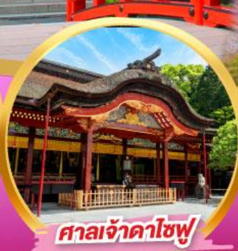
ศาลเจ้าดาไซฟุ