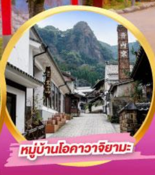
หมู่บ้านโอคาวาจิยามะ