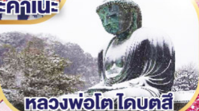
หลวงพ่อดโตโดบตล