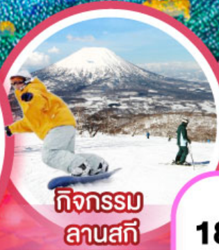
กิจกรรม ลานสกี

เดินทาง 18-23, 21-26 ก.พ. 68 14-19, 20-25 ก.พ. 68