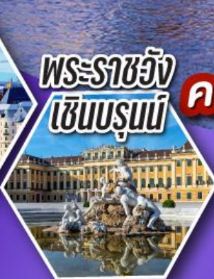
พระราชวัง เซินบรุนน์