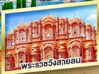
พระราชวังสกายลม