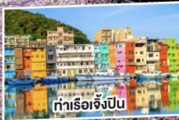
ท่าเรือเจิ้งปิ่น