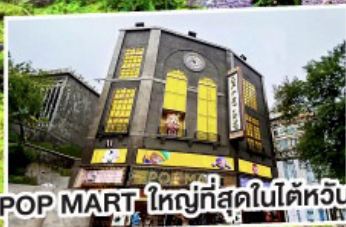
POP MART ใหญ่ที่สุดในไต้หวัน